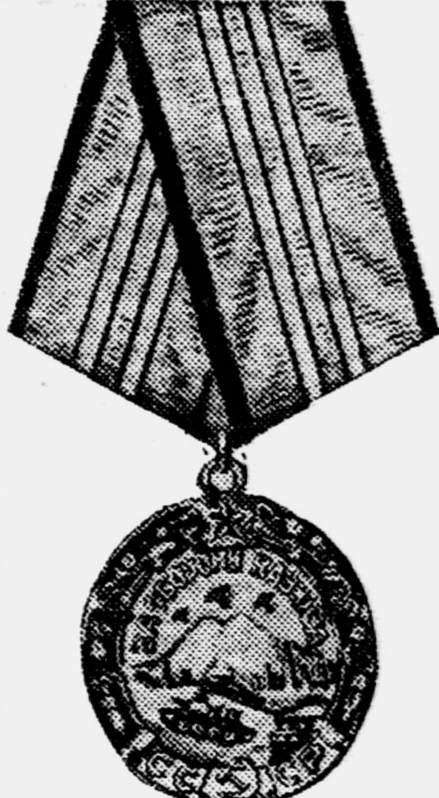
Лицевая сторона медали «За оборону Кавказа».

На лицевой стороне медали на фоне Кремлевской стены изображен танк с группой бойцов.