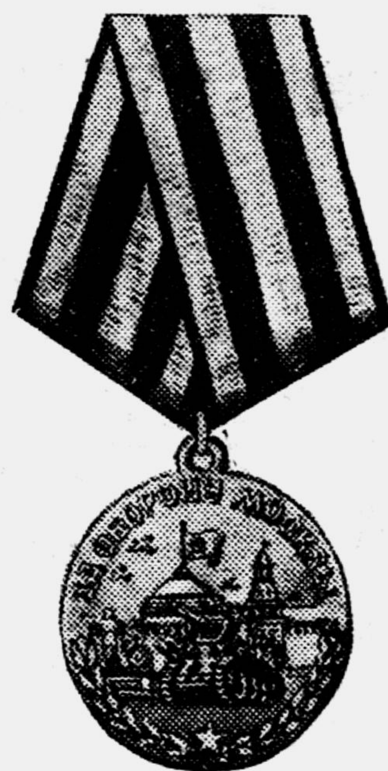
Лицевая сторона медали «За оборону Москвы».

Медалью «За оборону Москвы» награждаются лица, принимавшие непосредственное участие в обороне нашей столицы.