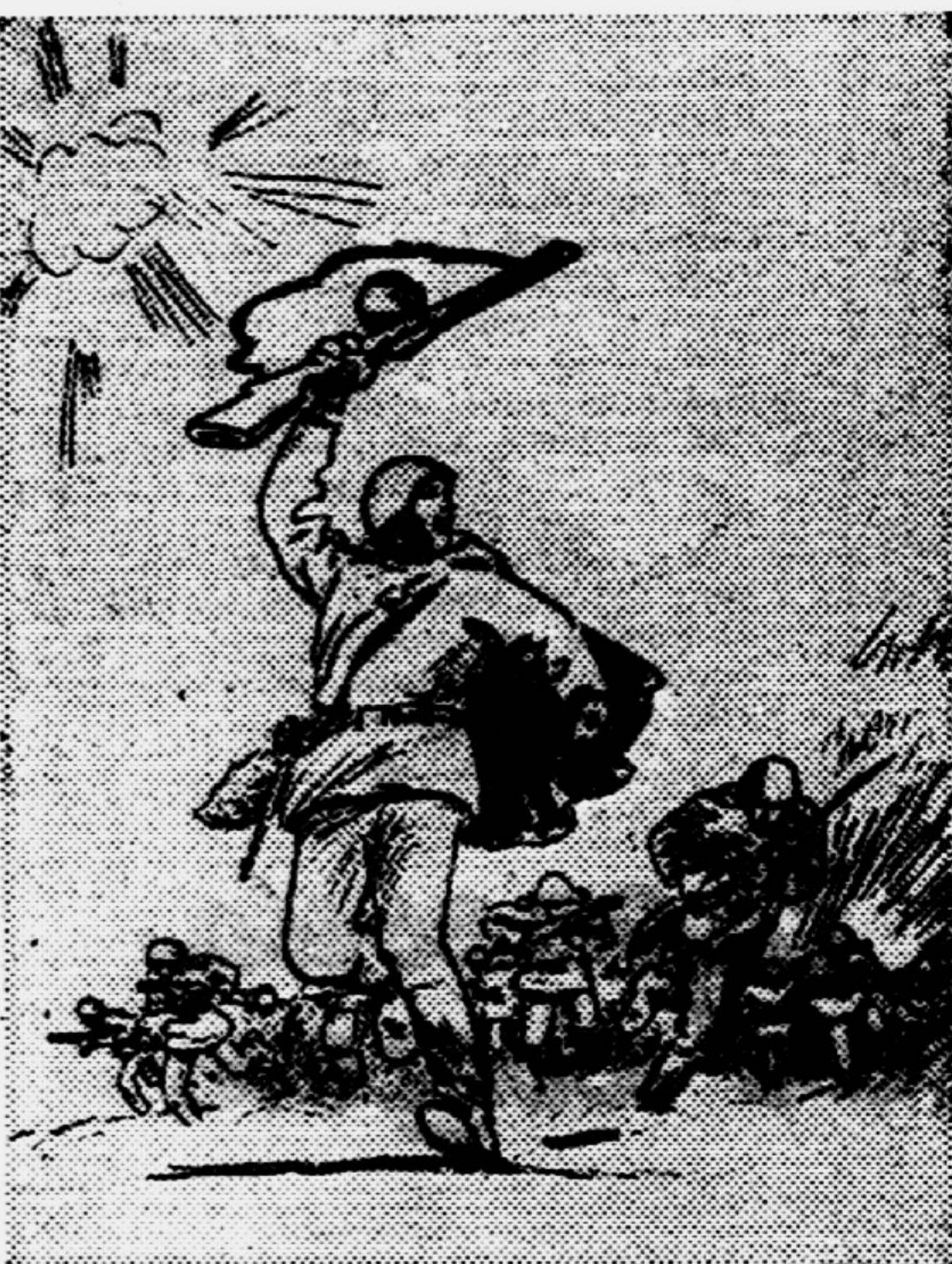
«За Родину! Вперед!».