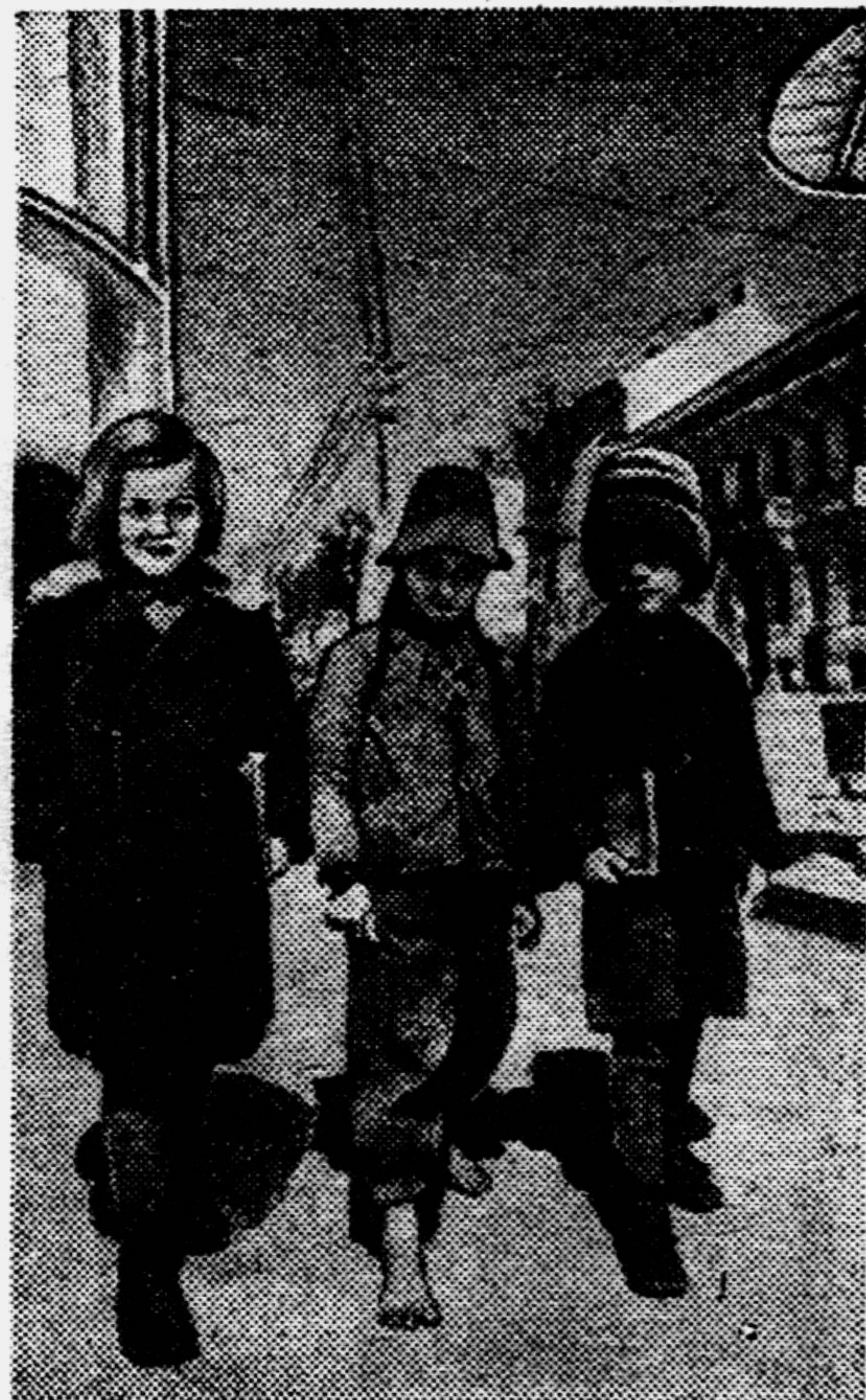
Здесь снова началась свободная жизнь. На снимке: дети возвращаются из школы.